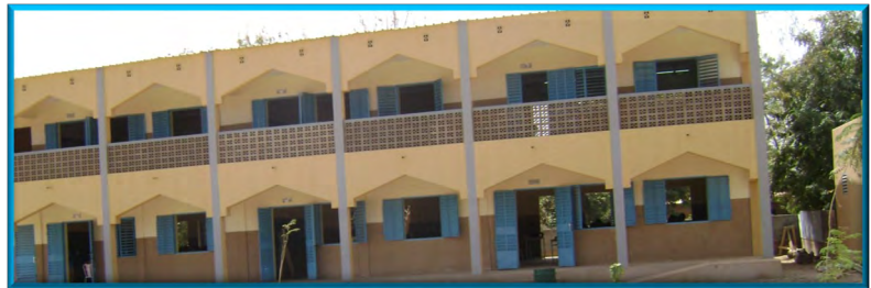
Construcción de 6 aulas. Colegio San José. Sâaba. (Burkina).

Se trata de responder con rapidez a situaciones de emergencia. Siempre ha sido una prioridad: Tsunami, Terremoto Ecuador, Covid-19, entre otros, son muestra de ello.