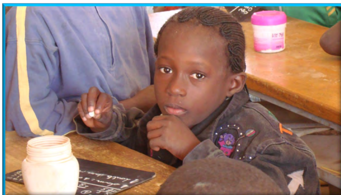
Se ayuda a unos 2800 niños en su escolarización.