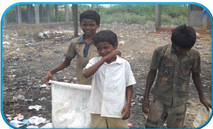
"Niños del basurero" del grupo tribal "Yaanadis". Atención médica, alimentación, educación, etc. En Eluru. (India)