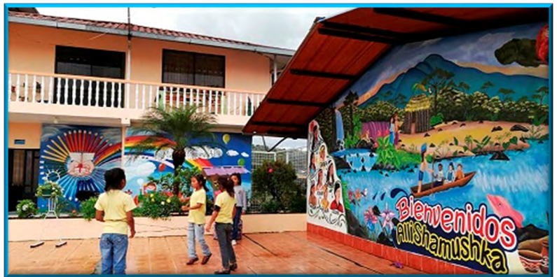
Apoyo al Proyecto Encuentro: niños de la calle. Puyo. (Ecuador)