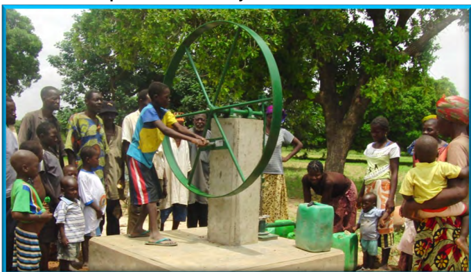
2019: 38 bombas de agua y 38 pozos, nuevos o rehabilitados