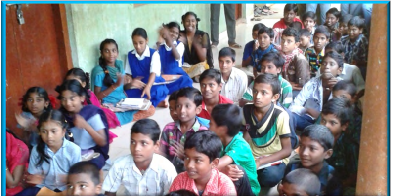
3 Centros de apoyo escolar: 2 en Madurai y 1 en Eluru. (India)