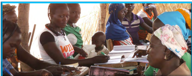
Alfabetización para unas 150 mujeres cada año.