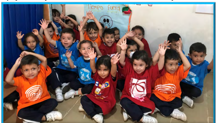
60 becas para niños con dificultades socio-económicas. Fundación Piccoli Saggi. Bucaramanga. (Colombia)