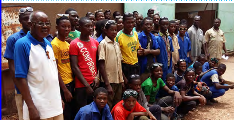
Educando crianças e jovens que não estão na escola