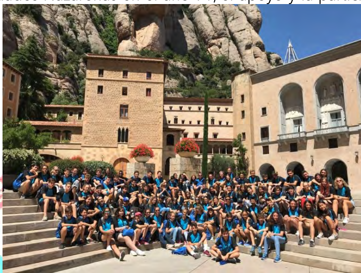
Semana Cultural en Barcelona. 2018