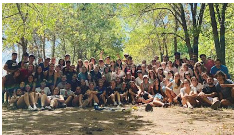
Campamento "Hogar y Taller" (Campamento Campanero, 3 al 5 de marzo)