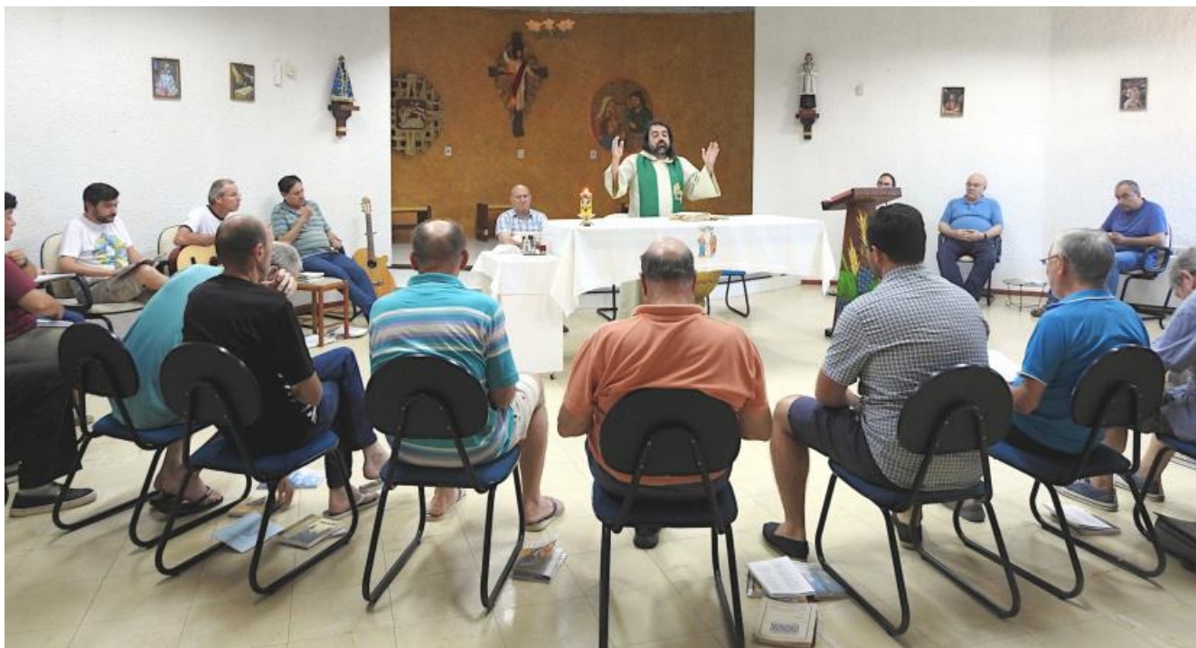
Retiro y Convivencia de los Hermanos de la Provincia. (Passo Fundo, 3 al 14 de enero)