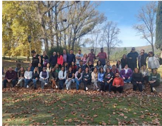
Raíces Nazarenas 2023 (Villa Sagrada Familia, Córdoba, 11 y 12 de mayo)