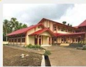
Formation house. Founded in 2011