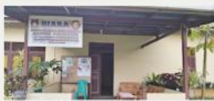
Community of mission. Founded in 2021