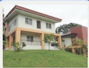
Formation house. Founded in 2009