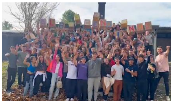
Retiros "Emaús" (Villa Sagrada Familia, Córdoba, 18 al 20 de mayo y 1 al 3 de junio)