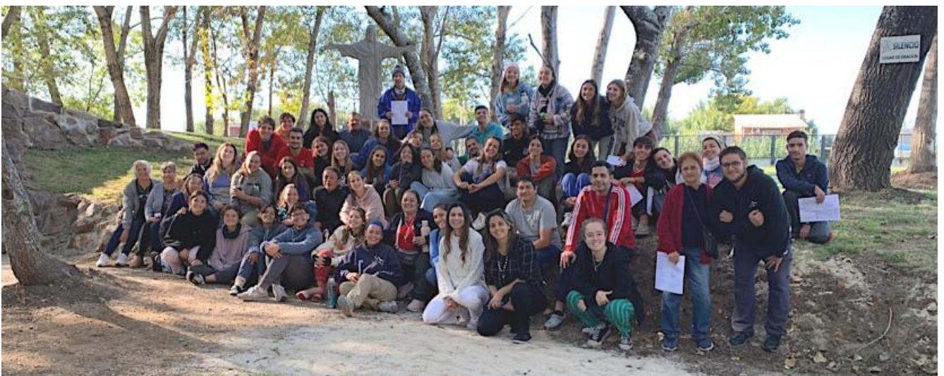
Misión Nazarena de Semana Santa (Gruta de Lourdes, Montevideo, 4 al 8 de abril)