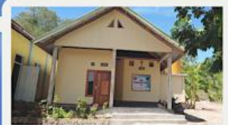
Community of mission. Founded in 2022