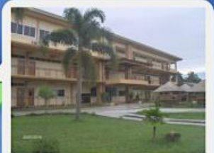
Gabriel Taborin College of Davao and Formation house Founded in 2000