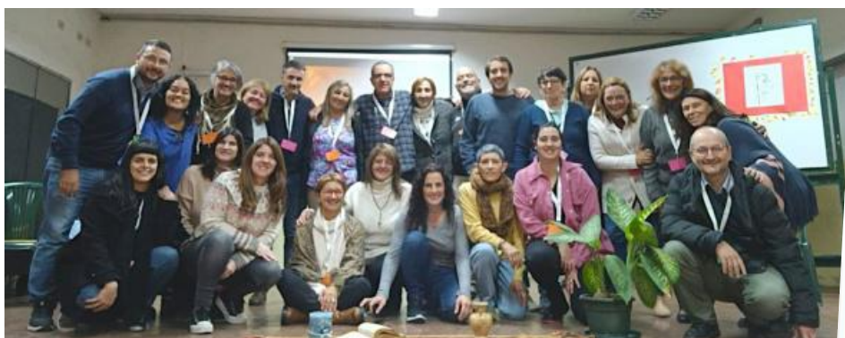
Encuentro de Educadores del Sector Uruguay (Aguada, 10 de junio)