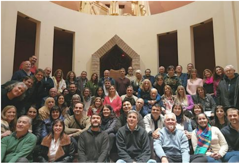
Asamblea de la A.S.F. (Escuti, Córdoba, 9 de junio)