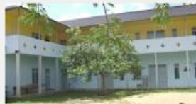
Community of mission. Founded in 2020