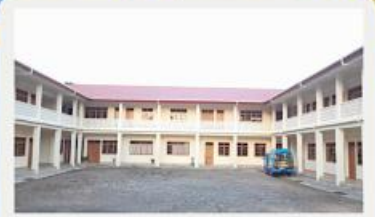
Casa de formação Fundação em 2013