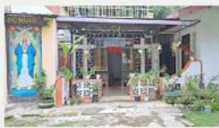
Community of mission. Founded in 2020