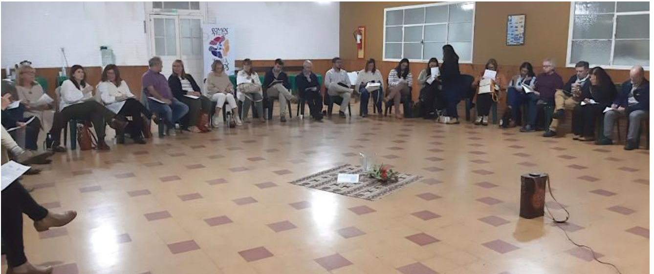
Encuentro de Directivos con el Consejo Directivo Provincial (C.D.P.) (Colegio Sagrada Familia, Montevideo, 27 de abril)