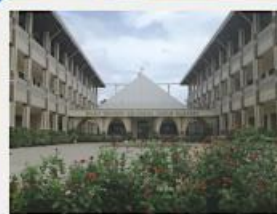
Formation house. Founded in 2014