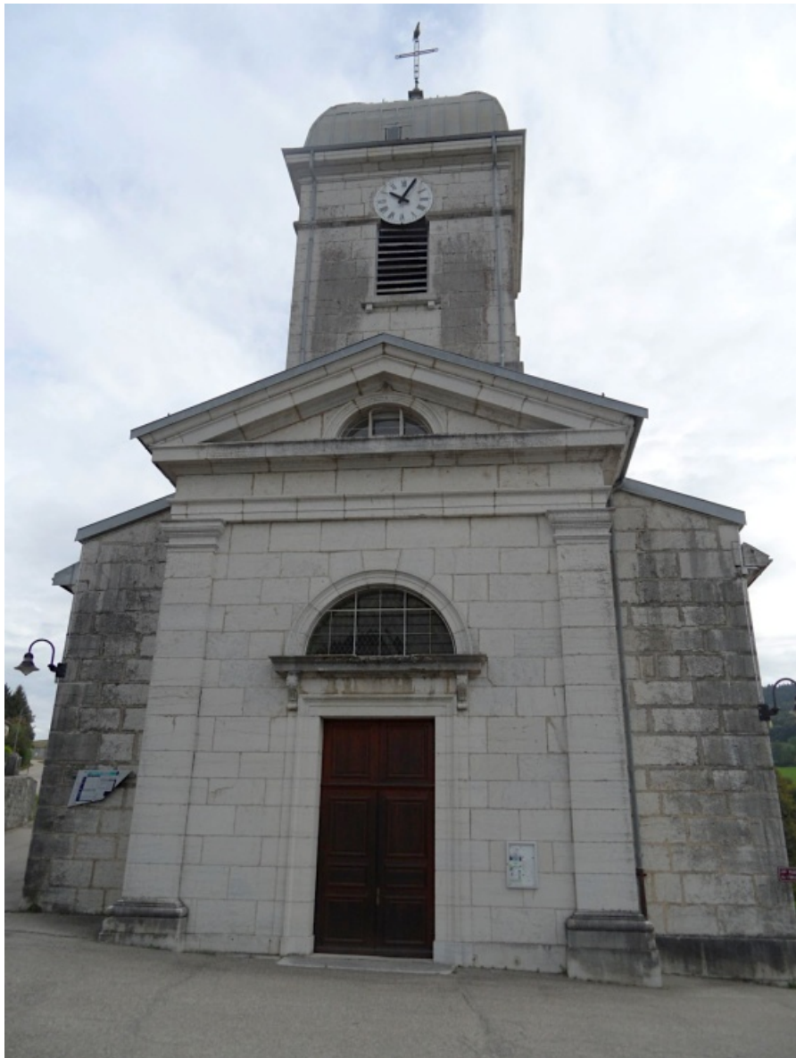
Iglesia de Belleydoux.