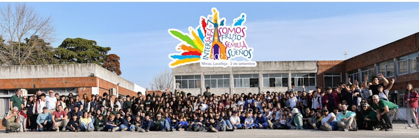
InterSa-Fa de los 7º años (2 de setiembre, Minas, Lavalleja)

El habitual encuentro anual de los alumnos de 7º grado (el primer año de Secundaria) de las obras de los Hermanos en Uruguay se realizó en el Colegio San José de Minas.