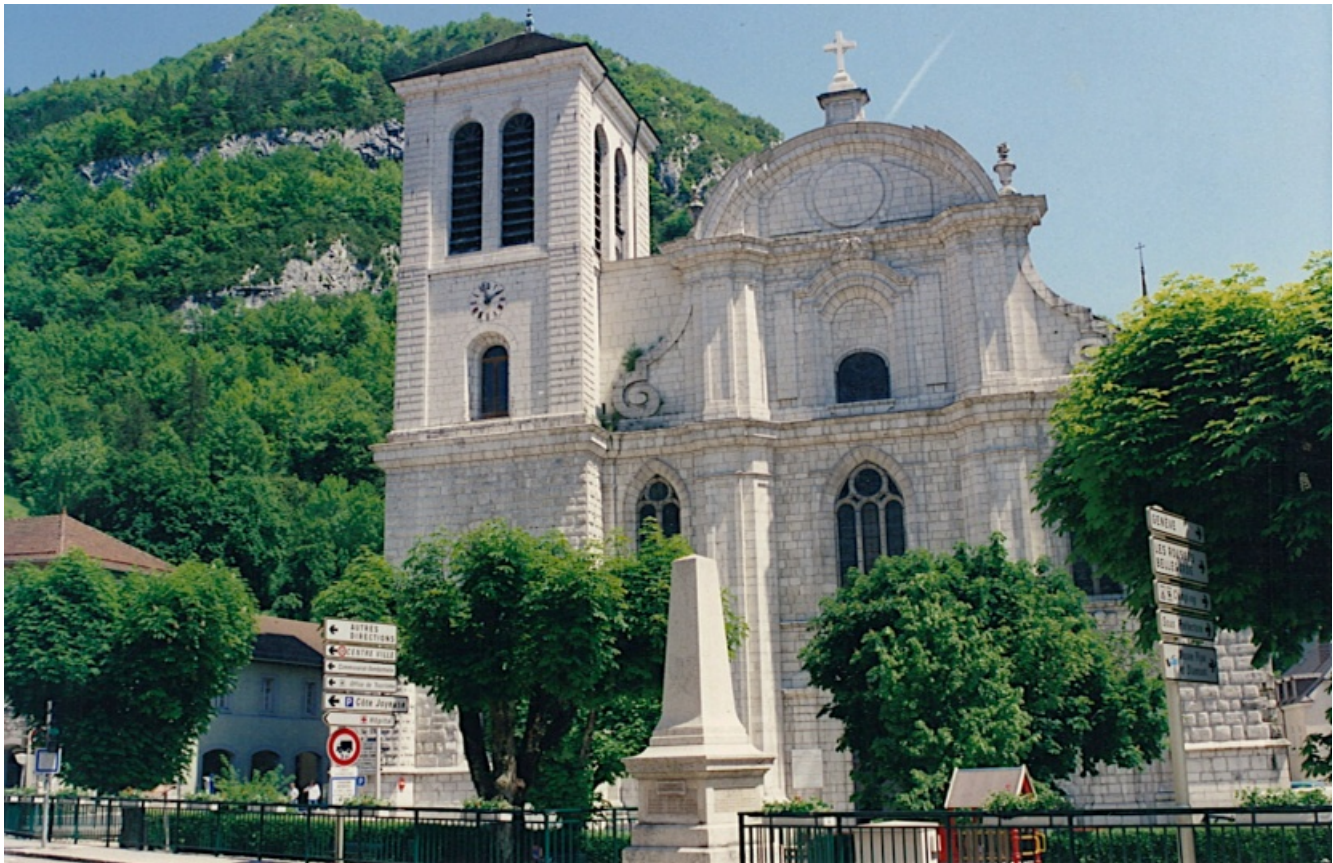
Catedral de Saint Claude.

última parte fue seguramente añadida cuando el Hermano Gabriel llegó posteriormente a la diócesis de Belley y completó el primer texto escrito en Saint-Claude.