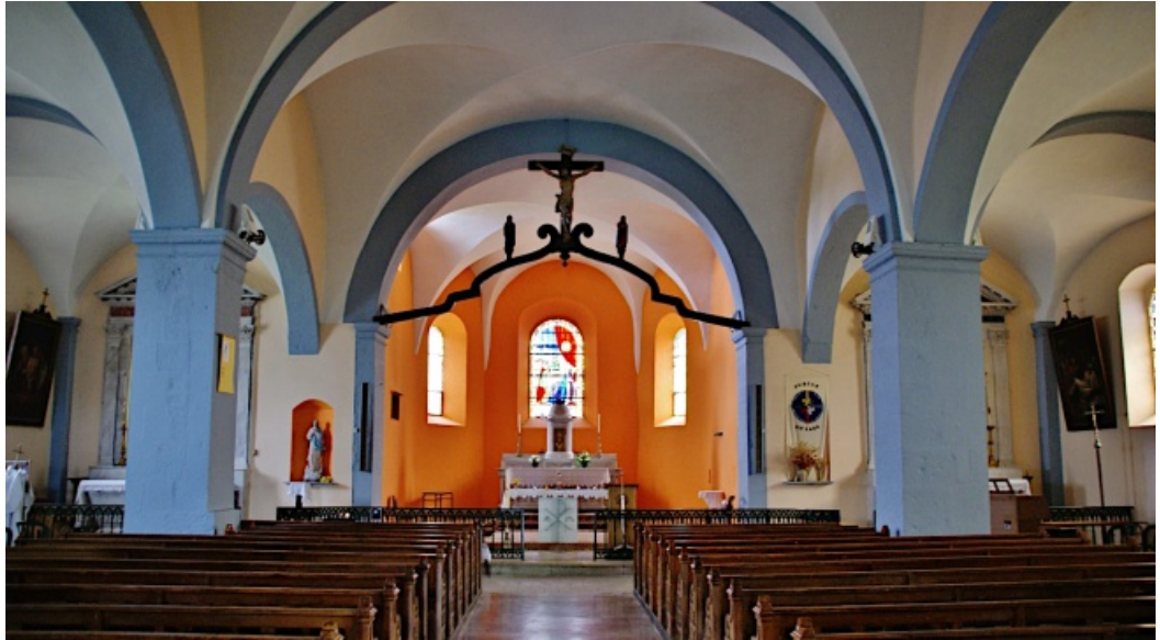
Vista interior de la iglesia de Les Bouchoux.

río de tiempo para poner las primeras bases de una comunidad religiosa.