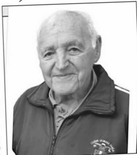
Com 70 anos no exercício do Magistério, exímio professor era tido como austero, paciente, humilde e perfeito na observância dos conteúdos