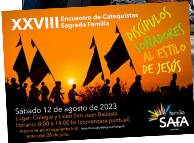
XXVIII Encuentro de Catequistas Sagrada Familia de Uruguay (Colegio San Juan Bautista, 12 de agosto)