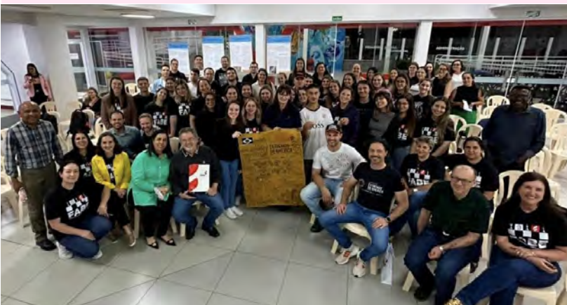
Exposição científica na FABE de Marau. Brasil