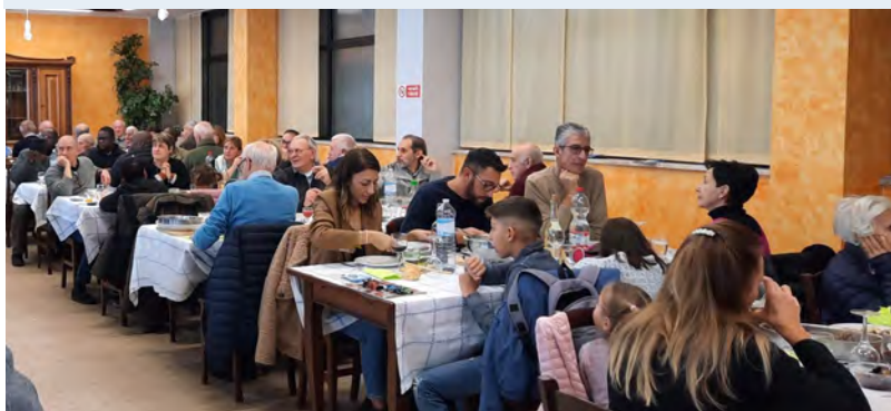
3 de dezembro: Almoço solidário em Villa Brea, organizado pelo CAM