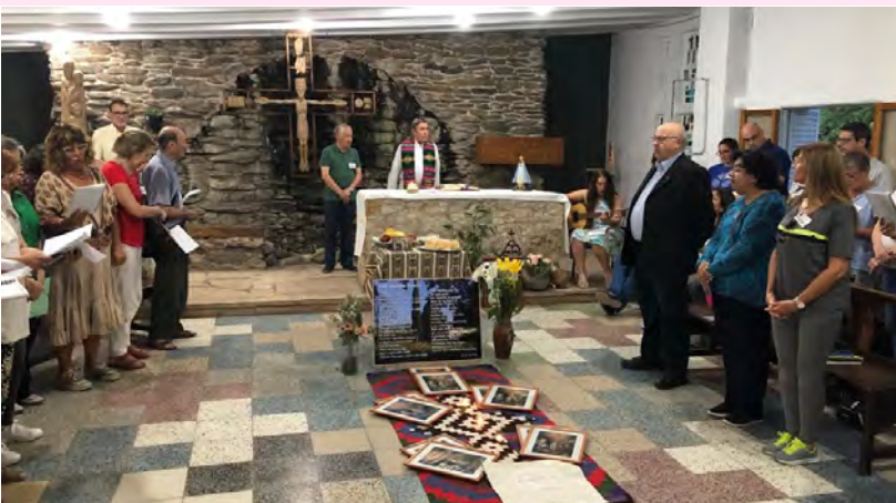
Encontro de Fraternidades da Argentina