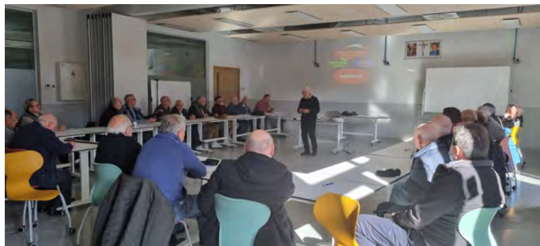
Jornada de formação sobre interioridade em Valladolid