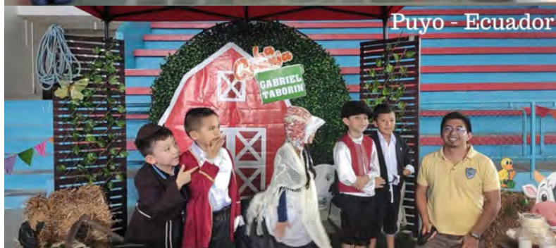
Puyo - Ecuador