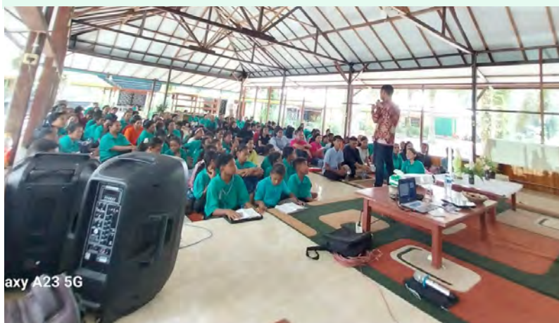
Com os alunos da Escola Pangkalan Bun (Ilha de Bornéu)