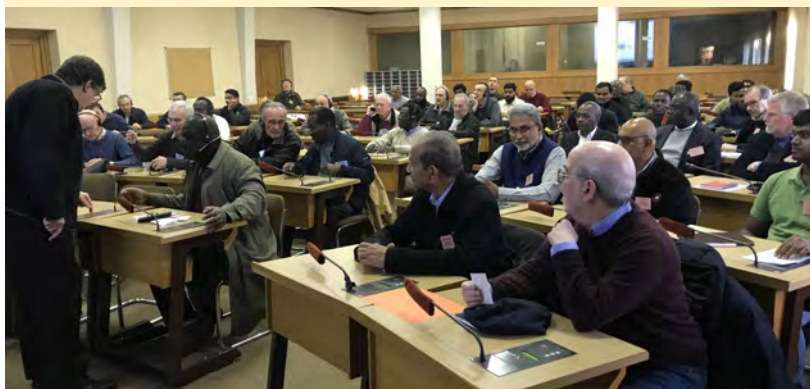
Encontro anual dos Irmãos de Roma das 14 Congregações