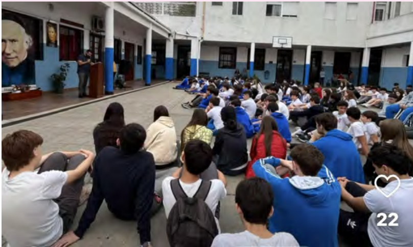
Celebração do Fundador na Sagrada Família de S. José de Mayo. (UY)