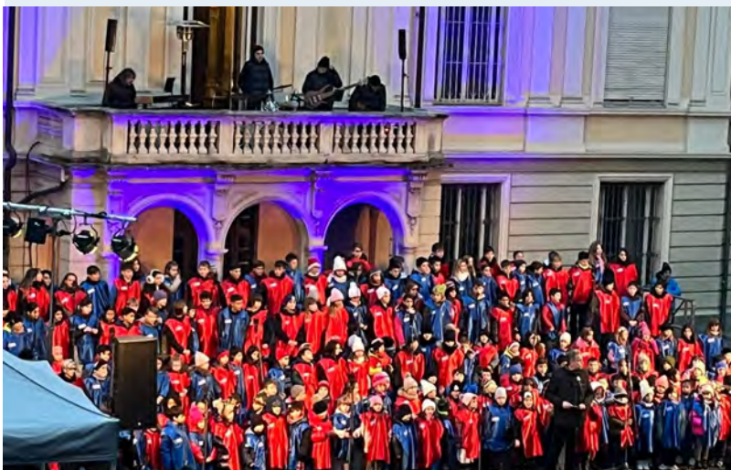
Crianças da Escola de Turim cantando no Natal.