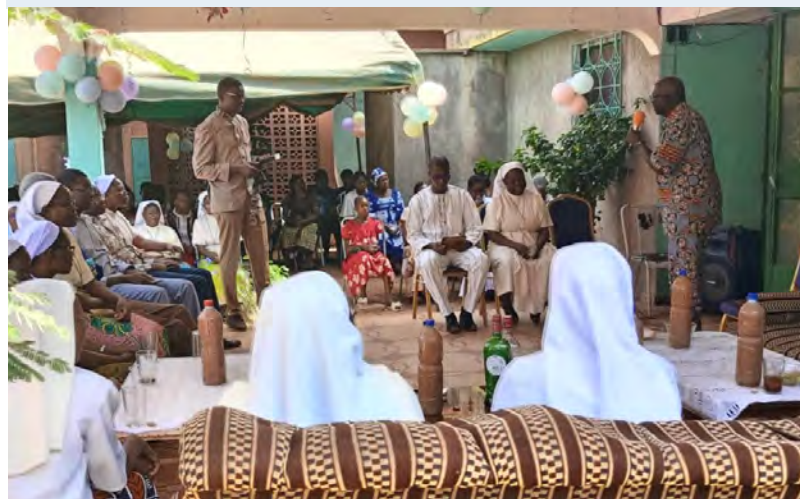
Dia da Sagrada Família: café da manhã com os Irmãos do Colégio Wendmanegda . (Burkina Faso)