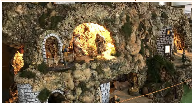
Veja a manjedoura do Colégio de Madrid clicando na imagem.