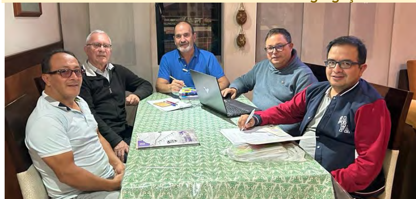
Com o Conselho Titular Comum na auditoria de Centros no Equador