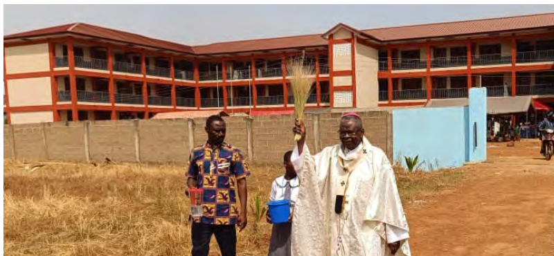
8 de dezembro: O Arcebispo abençoou a nova escola de Tamale. Gana.

Durante o período de Natal, além dos retiros para os alunos do Colégio de Turim, houve um recital para as crianças da creche, o concurso de canto primário, o concurso secundário de presépios e um evento de sensibilização para alunos do ensino médio e adultos, com reuniões de espiritualidade online. Na Paróquia de Marocchi os Irmãos animaram a preparação para o Natal.