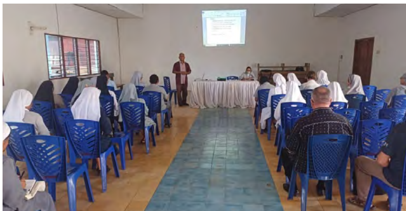
Irmãos do Timor participam de uma reunião de religiosos

Em sua reunião de dezembro, o Conselho da Vice-Província aprovou a abertura da comunidade missionária em Ponilala (Timor Leste).