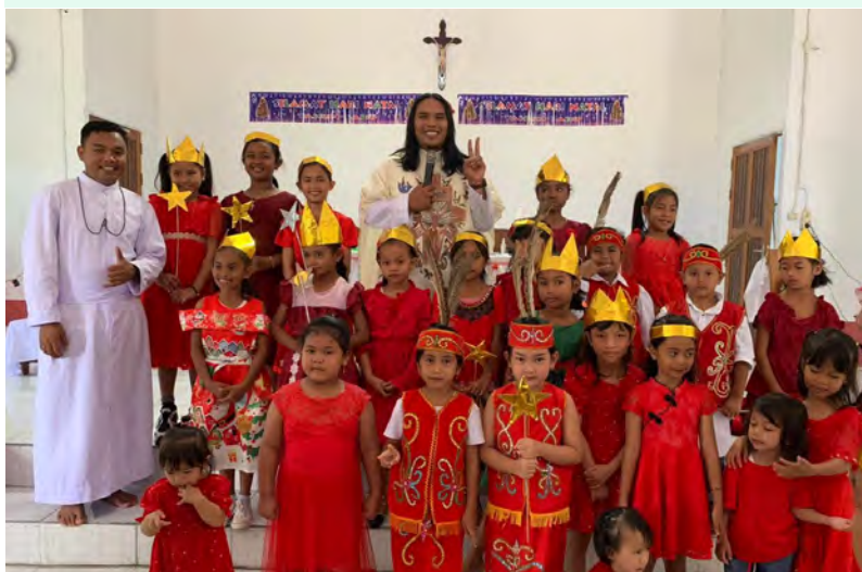
Atividade pastoral na paróquia de Nanga Tayap (Bornéu)