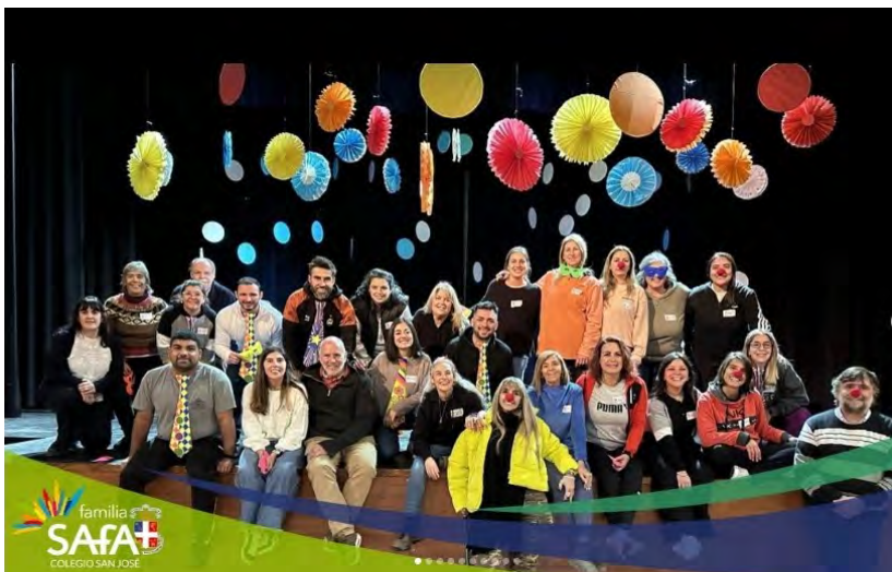
Reunião da Rede de Comunicação da ASF da Argentina. Tandil

A Faculdade da Associação Brasileira de Educação (FABE) continua a oferecer diversos cursos de formação universitária: Administração, Direito, Gestão de Empresas, Recursos Humanos e Pedagogia. Uma oferta universitária de qualidade para Marau (Brasil).