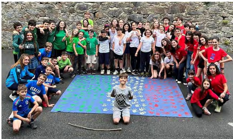
Acampamento de Grupo Pastoral de Turim em Challand