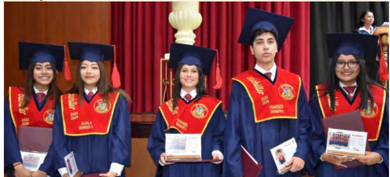
Alunos do ensino médio no dia da formatura em Ambato