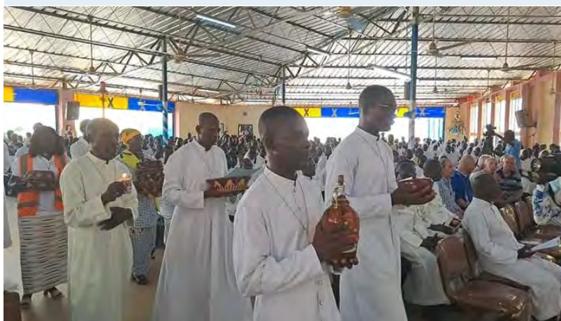
Festa de Santa Ana em Saaba: na procissão das oferendas