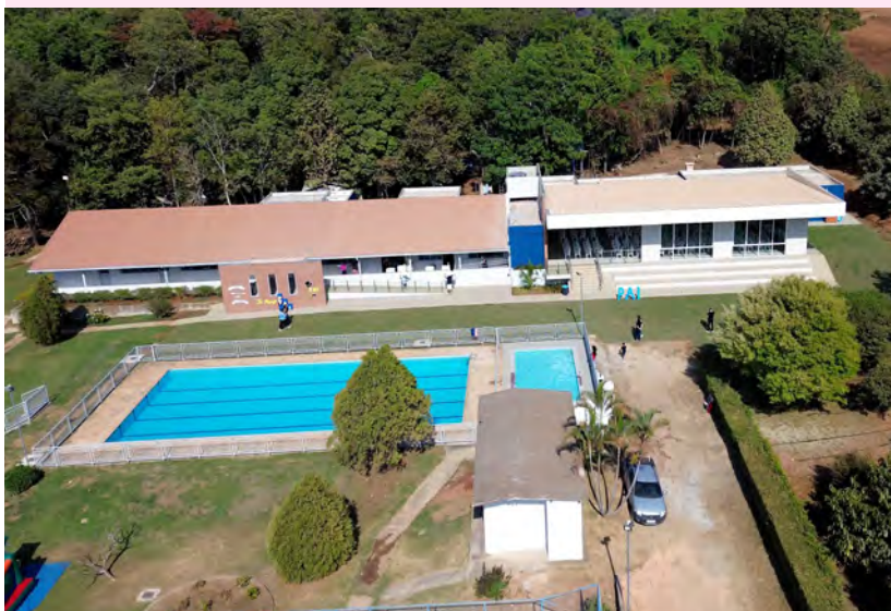
Renovação e ampliação das instalações da Chácara de Brasília