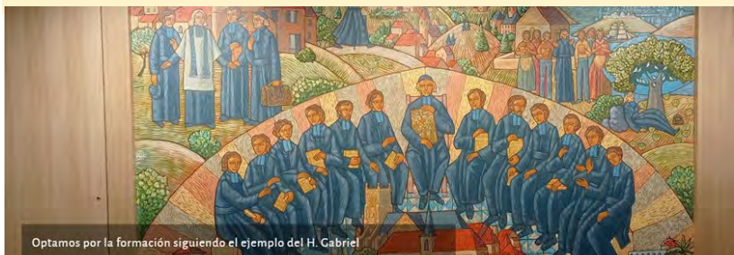
Curso "Seguindo os passos" (Tras las Huellas) em nossa plataforma de formação.