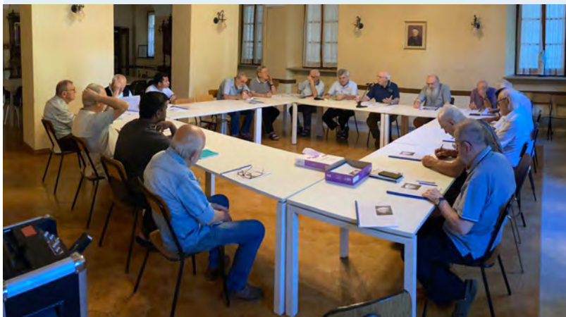
Irmãos da Itália durante os Exercícios Espirituais em Chieri