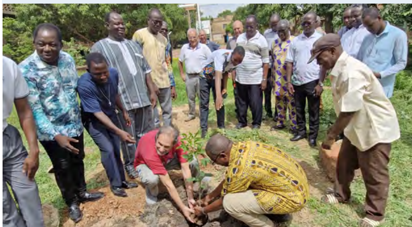
No final do 1º Capítulo Provincial: processo de revitalização