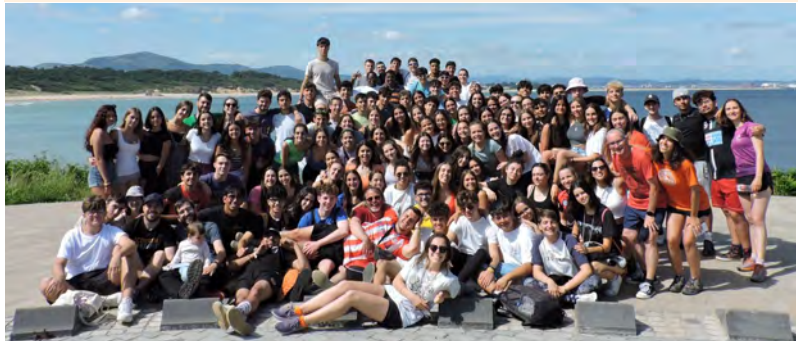
Acampamento de Estudantes de Bacharelado e Universitário