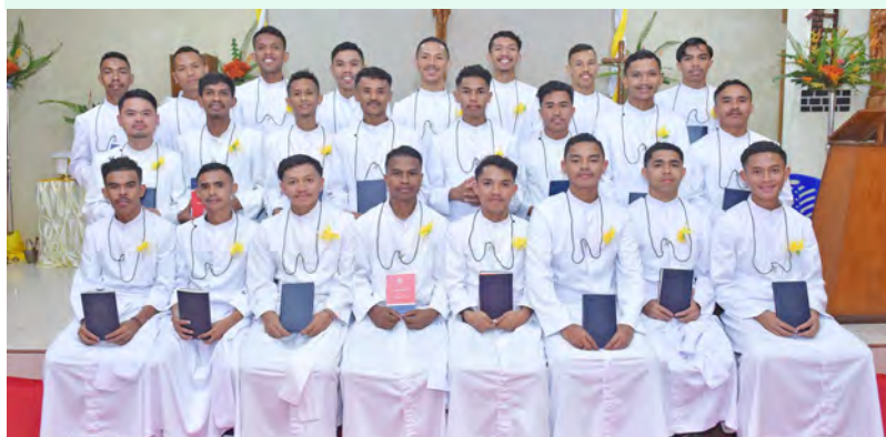
Profissão em Nita: "Somos colaboradores na obra de Deus"