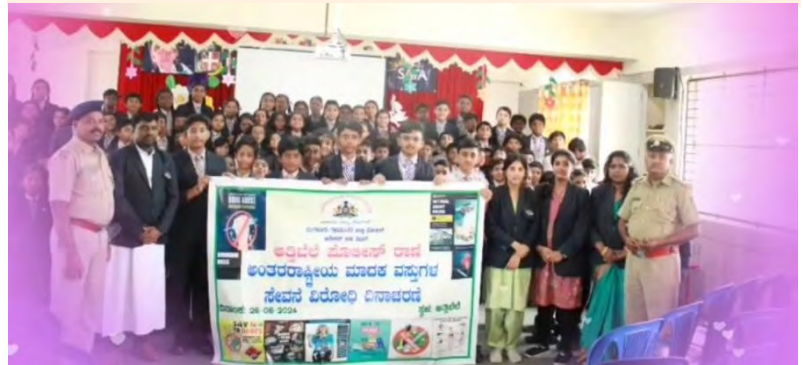
Bangalore: campanha de prevenção do uso de drogas