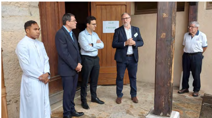
Apresentação da Nova Sociedade Kario em Belley

No início de agosto, o curso "Seguindo os passos" começou com a novidade de ser realizado em nossa própria plataforma de formação online: https://elearning.fsfbelley.net/ Mais um meio à disposição do cuidado da missão e do carisma.