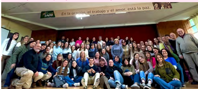
Encontro de catequistas na Sagrada Família em Montevidéu