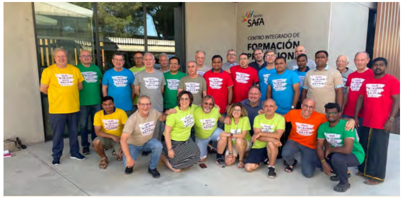
Irmãos e Leigos no XIX Capítulo Provincial. Valladolid

Na Colômbia e na Índia, no meio do curso, a animação vocacional é realizada com intensidade.