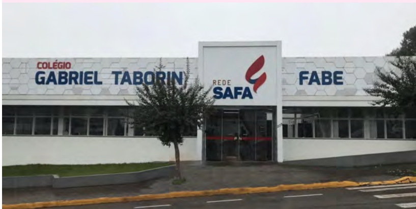
Fachada da Escola Gabriel Taborin e da FABE