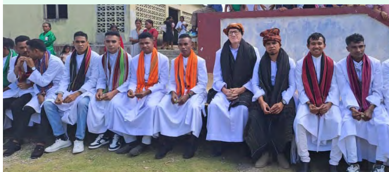
Acolhendo os Irmãos em Ponillala, Timor Leste