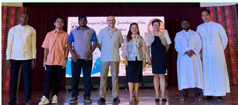
Abertura do curso no Gabriel Taborin em Davao