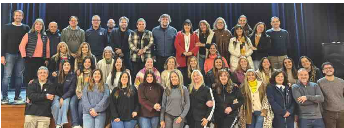
Encuentro de Directivos de la Asociación Sagrada Familia (Argentina) (Colegio San José, Tandil, 21 y 22 de mayo)