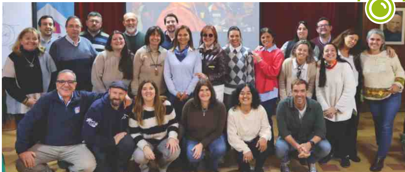
Encuentro de Consejos de Dirección de las Obras y Comisiones Directivas de las Cooperativas - Uruguay (Colegio Sagrada Familia de Montevideo, 8 de mayo)