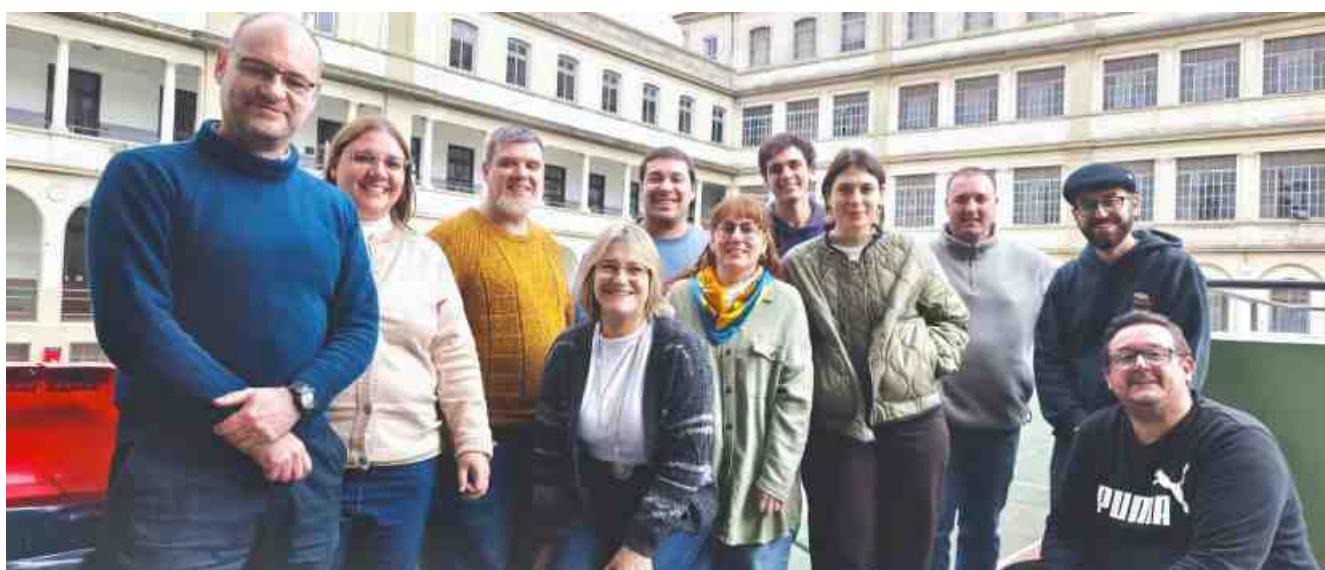
Encuentro de la red de comunicación Sa-Fa Uruguay (Colegio Sagrada Familia de Montevideo, 16 de mayo)