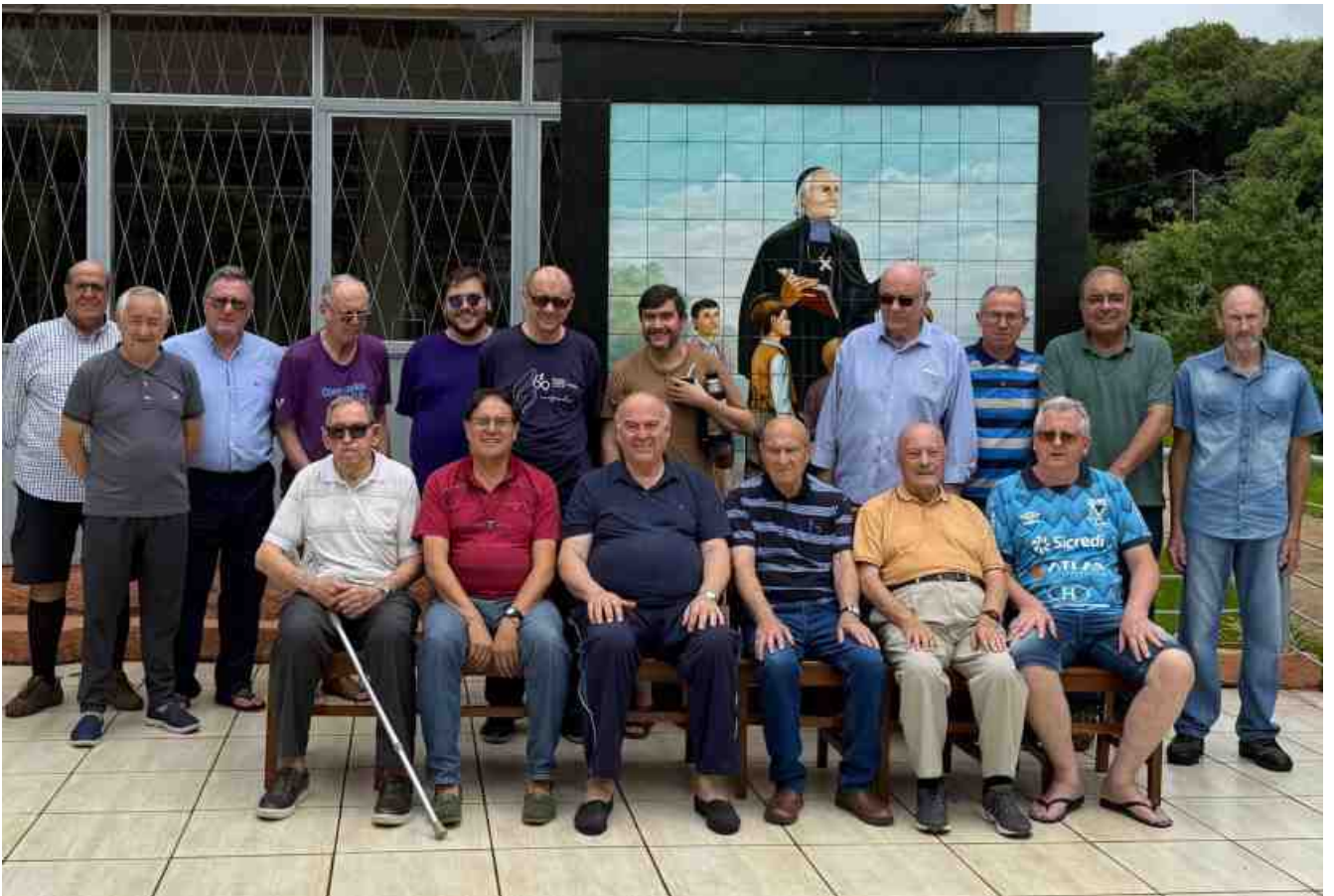
Retiro y Convivencia de los Hermanos de la Provincia (Passo Fundo, Brasil, 4 al 11 de enero)