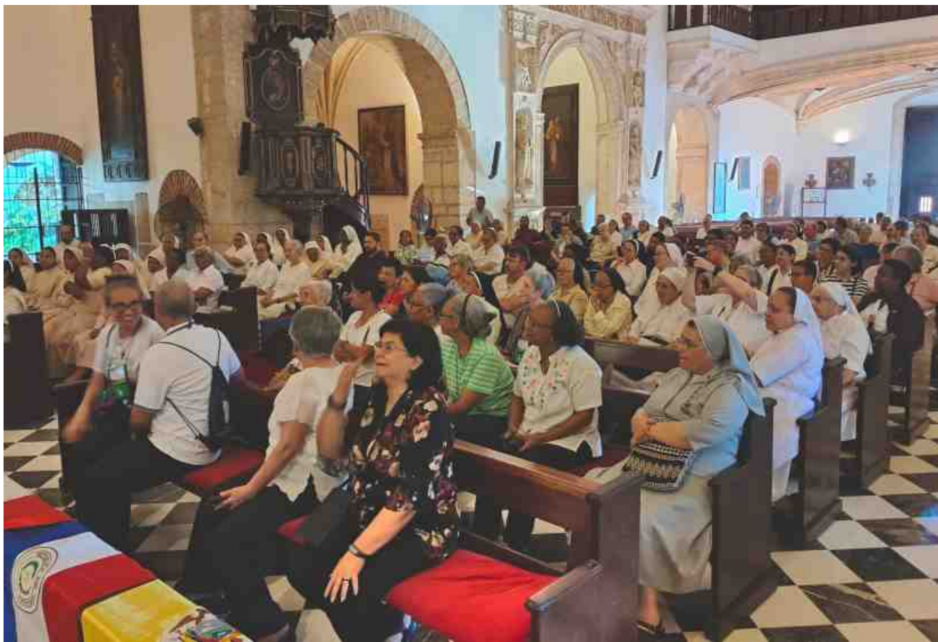
Encuentro de la vida consagrada de Santo Domingo con los participantes de la L Junta Directiva de la CLAR en la histórica iglesia de los PP Dominicos, donde Fray Antonio de Montesinos pronunció en 1511 su famosa homilía.

En esta nueva alborada, queremos dar pasos concretos que van tejiendo vida: