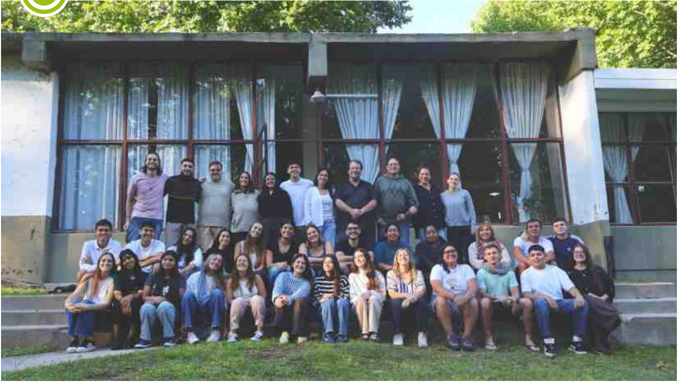
Asamblea de la Pastoral Juvenil - Argentina (Villa Sagrada Familia, Córdoba, 14 y 15 de marzo)