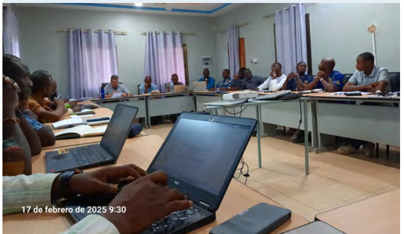
Formación con responsables de los Colegios en Koudougou (BF)