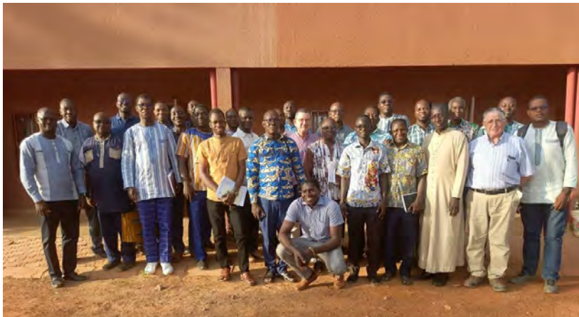
Burkina Faso: hacia una cultura del trabajo en equipo y en red