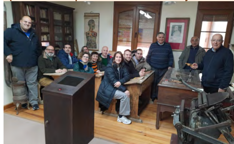
Formación para formadores en La Horra.