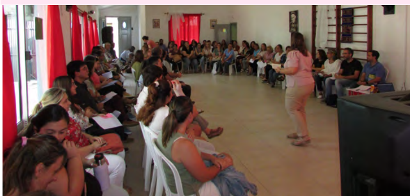
Comienza el año: los profes se preparan. Estos son los de S. José Mayo