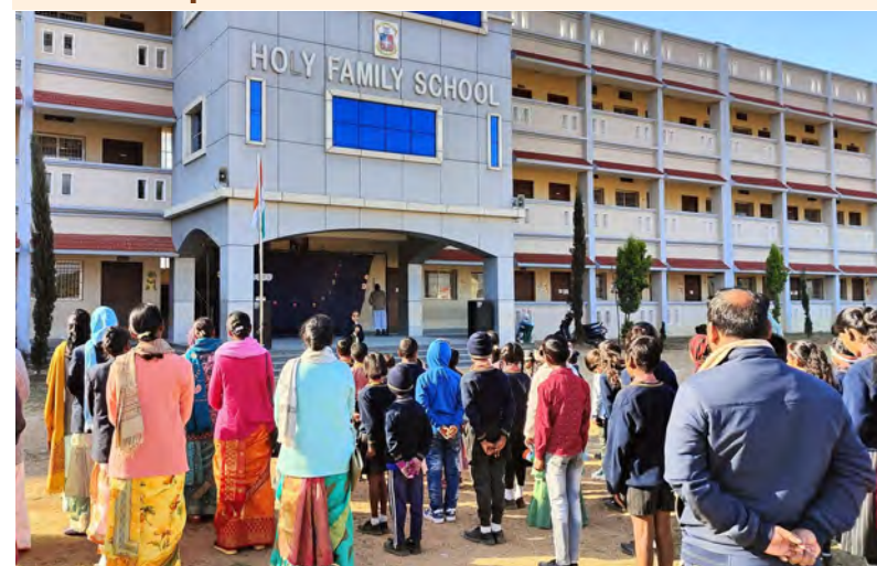
Celebrando el día de la República en Kurdeg (India)