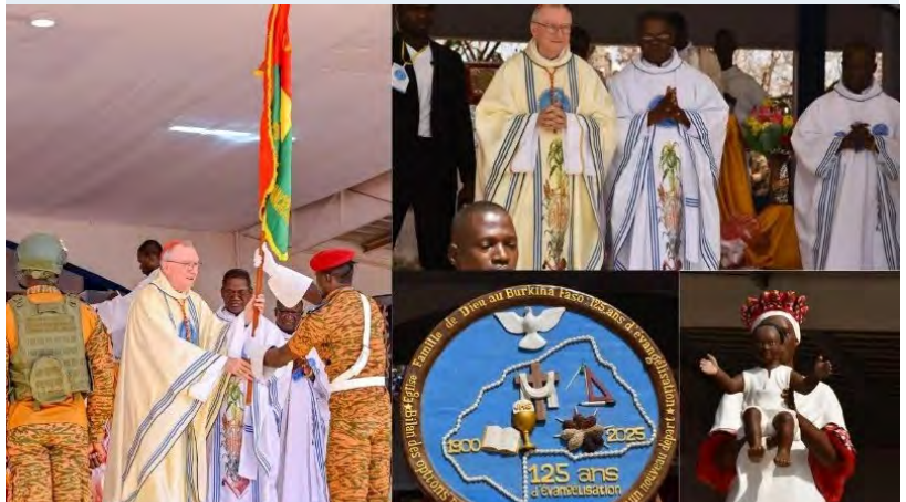
En el 125 aniversario de la Evangelización de Burkina Faso