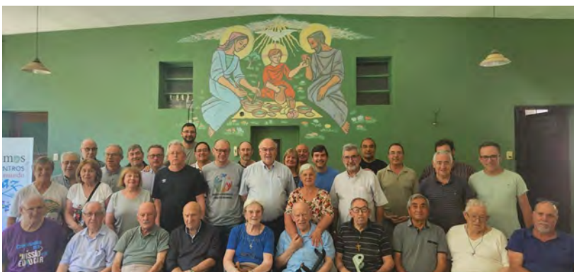
Hermanos y Fraternidades al acabar el Retiro anual

Un nutrido grupo de jóvenes de Brasil y Uruguay están organizando actividades con la finalidad de conseguir algunos fondos para asistir el 2º Encuentro de Jóvenes de la Familia Sa-Fa en Villa Brea y posteriormente asistir al Jubileo de los jóvenes en Roma.