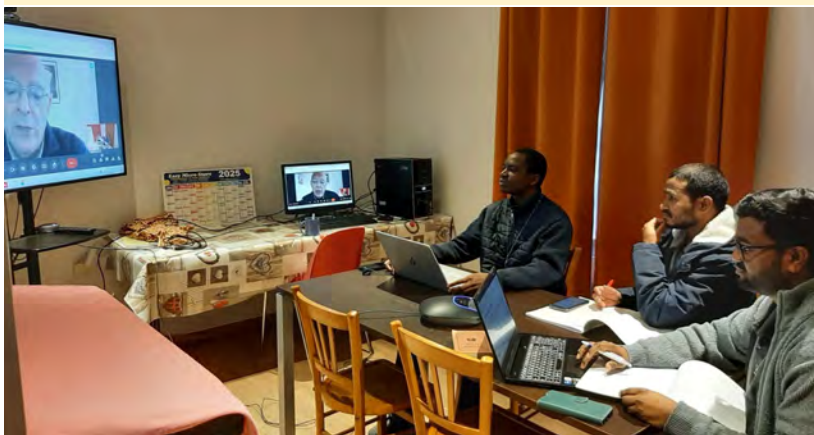
Belley: los 3 Hermanos de curso de formación carismática