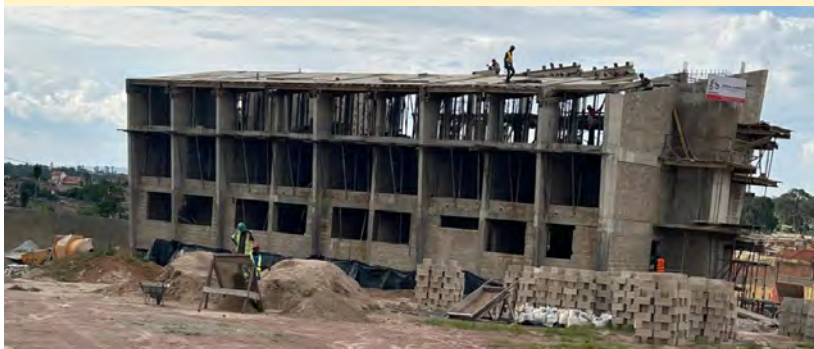
Avanza la construcción de la casa de Formación de Huambo