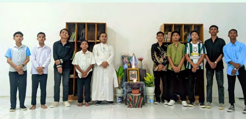
Hermanos de Pangkalan Bun (ID) con alumnos del internado