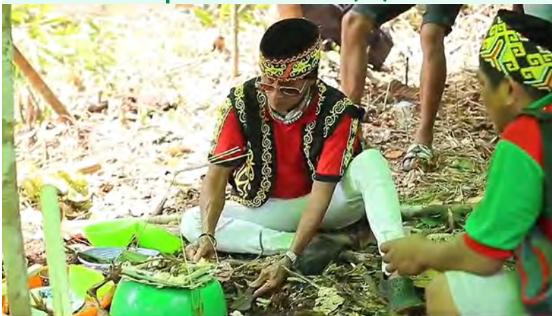
Ceremonia tradicional de limpieza del terreno: Internado de Balai.