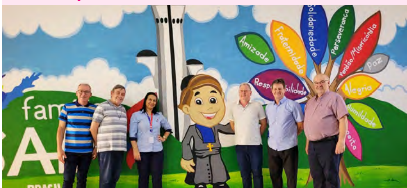
El H. Gabriel en la nueva escuela de Sobradinho – Brasilia.