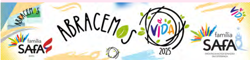
Lema da Província para 2025: abracemos a vida