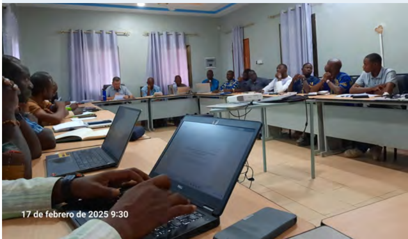
Formação com Líderes Escolares em Koudougou (BF)