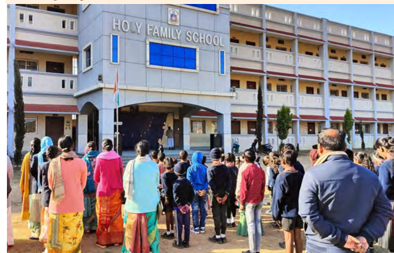
Comemorando o Dia da República em Kurdeg (Índia)