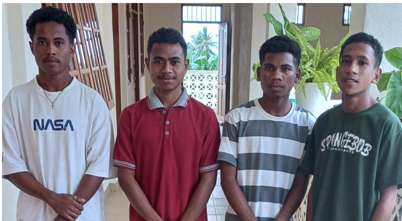
Os 4 novos aspirantes em Bucoli (TL)