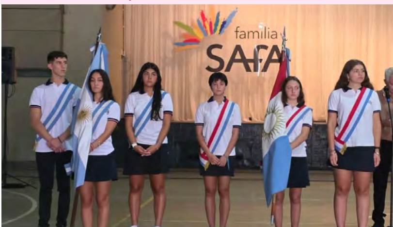
Inauguração do ano letivo de 2025 na Escola Taborin de Córdoba