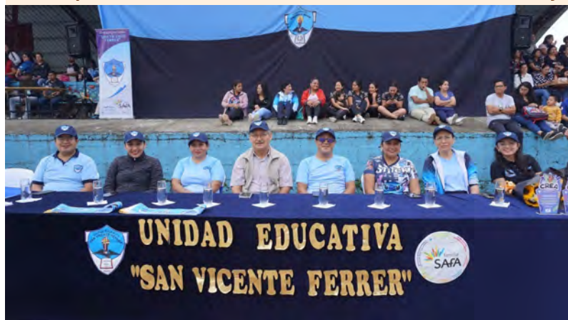
Abertura do Campeonato "Ir. Gabriel" em Puyo