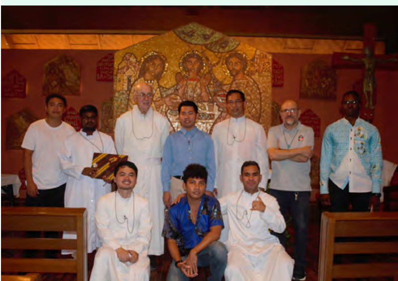
Os Irmãos das Filipinas comemoram 25 anos de fundação